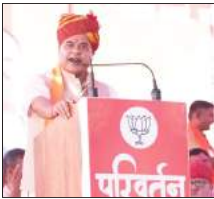
असम के सीएम हिमंत बिरुव सर्मा रैली को संबोधित करते हुए।