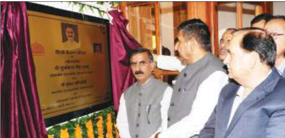
गाँविक वास्तुकला का उत्कृष्ट उदाहरण पेश करता है, जो पर्यटकों और स्थानीय लोगों के लिए आकर्षण का प्रमुख केन्द्र