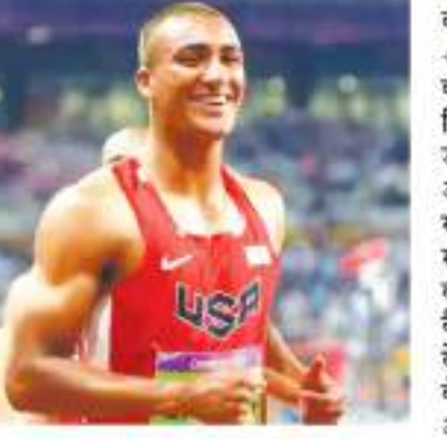
स्तर पर अपनी उपलब्धियों से पहले, इटन ने एक कॉलेजिएट ट्रैक-एंड-फील्ड एथलीट के रूप में दुनिया में तालका मचा दिया था। उन्होंने पांच राष्ट्रीय कॉलेजिएट एथलेटिक एसोसिएशन (एनसीए) चैंपियनशिप (तीन डिफेन्सिव में

नई दिल्ली। दो बार के ओलंपिक चैंपियन और डिफेन्सिव इवेंट में दो बार 9,000 अंकों से अधिक अंक हासिल करने वाले एकमात्र खिलाड़ी एश्टन इटन, अगले महीने होने वाले वेदांत दिल्ली हाफ मैराथन 2023 के अंतरराष्ट्रीय इवेंट एंबेसडर होंगे। रेस प्रमोटर प्रोक्सिम इटनेशनल गुरुवार के उक्त घोषणा की। अमेरिकी एथलीट ने लगातार ओलंपिक (2012 और 2016) में डेकाथलॉन स्पर्धा में स्वर्ण पदक जीता है। उन्होंने डेकाथलॉन स्पर्धा में दो विश्व चैंपियनशिप स्वर्ण (2013 और 2015) और 2011 विश्व चैंपियनशिप में एक रजत पदक भी जीत है। इसके अलावा, उन्होंने हेटाथलॉन इवेंट में भी अपनी कर्बिलियत साबित की है। इटन ने 2012 में आईएफएफ वर्ल्ड इंडोर चैंपियनशिप में 6,645 अंकों के स्कोर के साथ अपना हेटाथलॉन विश्व रिकॉर्ड तोड़ दिया। उन्हें हेटाथलॉन इवेंट में तीन विश्व इंडोर चैंपियनशिप स्वर्ण (2012, 2014 और 2016) भी जीता है। 2012 के लंदन ओलंपिक खेलों में, इटन ने डिफेन्सिव इवेंट में एक और विश्व रिकॉर्ड दर्ज किया और फ्रांस के केविन मेयर