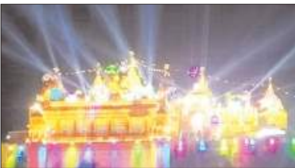
सितंबर को ऊंचागांव और बरसाना निज महल के साथ अरुण सखी मंदिर में ललित जी का जन्म अभिषेक कराया जाएगा। वहीं एक दिन पहले 22 तारीख को नंदगांव के नन्दभवन से समाज चलकर श्रीराधारानी निज महल बरसाना पहुंचेगी और वहां बधाइयां गई जाएंगी।

मथुरा/टीएम एक्शन इंडिया भाद्रपद शुक्ल पक्ष की आठमी को राधा जी का जन्मोत्सव मनाया जाएगा। बरसाना सहित समूचा ब्रज राधारानी के जन्मोत्सव की तैयारियों में जुटा है। बरसाना नन्दगढ़ कर तैयार है। लाइली जू के जन्मोत्सव में शामिल होने के लिए श्रद्धालुओं का पहुंचना शुरू हो गया है। शुक्ल पक्ष की छठी तिथि को नंदगांव से जन्म की बधाई देने समाज बरसाना निजमहल आया। आठमी को रात्रि दो बजे से समाज द्वारा जन्म के पदों का परम्परागत गायन किया जाएगा और प्रातःकाल (ब्रह्मवेला) में श्रीराधारानी का जन्मोत्सव सुबह 4 बजे से 5 बजे तक महाभिषेक कर मनाया जाएगा। वहीं 24 दिसम्बर यानी नवमी से बुढ़ी लीलाओं का आयोजन प्रारंभ हो। 21