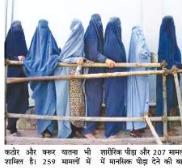
कठोर और कठोर यातना भी शामिल है। 259 मामलों में शारीरिक पीड़ा और 207 मामलों में मानसिक पीड़ा देने की बात

न्यूयॉर्क। अफगानिस्तान में तालिबान राज की वापसी के बाद कठोर शासन की पुनरावृत्ति सामने आ रही है। संयुक्त राष्ट्र (यूएन) की 1,600 से अधिक लोगों एक रिपोर्ट में बताया गया कि अफगानिस्तान में हिरासत में लोगों को तालिबानी अधिकारी कठोर और अमानवीय यातना दे रहे हैं। तालिबान मानवाधिकार का खुलकर उल्लंघन कर रहा है। रिपोर्ट के अनुसार आरोपितों से अपराध स्वीकारने के लिए छत से लटकवाया जाता है। बिजली के झटके सहित कई और अमानवीय यातनाएं दी जाती हैं। इसमें 11 प्रतिशत मामलों में महिलाओं को भी यह