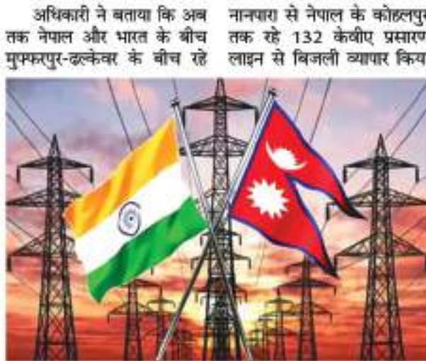
अधिकारी ने बताया कि अब तक नेपाल और भारत के बीच मुम्बई-पुर-दल्केवर के बीच रहे नानपारा से नेपाल के कोहलपुर तक रहे 132 केवीए प्रसारण लाइन से बिजली व्यापार किया जा सकता है। नेपाल और भारत के बीच इस समय 450 मेगावाट बिजली का नियमित व्यापार हो रहा है। इसे बढ़ा कर जल्द ही 550 मेगावाट करने पर पहले ही सहमति हो चुकी है। नेपाल के कई इन्फ्रे पावर को भारत में बिजली बेचने के लिए हरी झंडी दे दी गई है।

काठमांडू। भारत और नेपाल के बीच अब राज्य स्तर पर भी विद्युत खरीद-विक्री पर सहमति बन गई है। दोनों देशों के बीच हुई बैठक के बाद केन्द्र सरकार के अलावा अब राज्य सरकारों को भी नेपाल से बिजली खरीदने और बेचने की अनुमति दी गई है। नई दिल्ली में पिछले दो दिनों तक इंडो नेपाल ज्वॉइंट टेबिलकल टीम की बैठक में इस तरह की सहमति होने की जानकारी दी गई है। नेपाल विद्युत प्राधिकरण और भारत के ऊर्जा मंत्रालय अंतर्गत विद्युत व्यापार निगम के अधिकारियों की बैठक में दोनों देशों के बीच रहे 132 केपीए प्रसारण लाइन से सीमावर्ती राज्यों को बिजली खरीदने और बेचने पर सहमति हुई है।