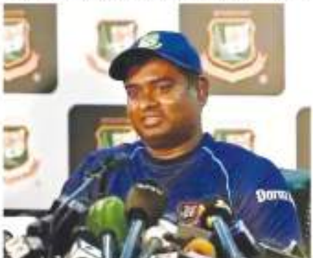
दौरान हमेशा उनका समर्थन किया था, जबकि पूर्व भारतीय स्टार को नजमुल हुसैन की सफलता के पीछे एक प्रमुख कारण माना जाता है।