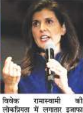
विवेक रामास्वामी की लोकप्रियता में लगातार इजाफा

देखा जा रहा है। वहीं निक्की हेली भी धीमी शुरुआत के बाद अब तेजी से आगे बढ़ रही हैं। नए सर्वे में 13 प्रतिशत रिपब्लिकन मतदाताओं ने विवेक रामास्वामी का समर्थन किया है। वहीं निक्की हेली को 12 प्रतिशत का समर्थन मिला है। न्यूजर्सी के गवर्नर क्रिस्टी स्टूडी 11 प्रतिशत मतदाताओं का समर्थन पाकर चौथे स्थान पर हैं। वहीं रॉन देसांतिस छह प्रतिशत समर्थन