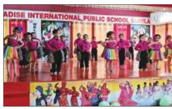
श्रृंखला तैयार की थी, जो उनके दादा-दादी के प्रति उनके प्यार और प्रशंसा को दर्शाती थी। जब दादा-दादी और माता-पिता मासूमियत से भरे अपने बाल समूह का प्रदर्शन देख रहे थे तो