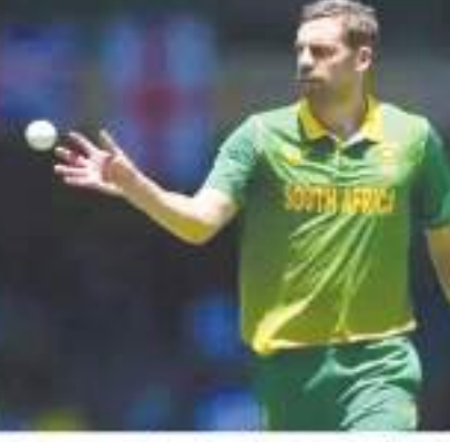
चोट की शिकायत की थी, और एशियाई खेलों के लिए विश्व कप टीम से बाहर कर दिया गया है। रॉब बाल्टर ने कहा, एनरिक और सिसंडा के लिए 50 ओवर

जोहानसबर्ग। तेज गेंदबाज एनरिक नॉर्टजे और सिसंडा मगाला चोटों के कारण भारत में होने वाले आगामी एकदिवसीय विश्व कप से बाहर हो गए हैं, दक्षिण अफ्रीका के सफेद गेंद के मुख्य कोच रॉब बाल्टर ने इसकी पुष्टि की है। इन दोनों की जगह एंड्रिये फेडलुकवायो और लिजाद विलियम्स को 15 सदस्यीय विश्व कप टीम में नामित किया गया है। नॉर्टजे को पीट के निचले हिस्से में स्ट्रेस फ्रैक्चर हुआ है। पीट के निचले हिस्से में पेंटन की शिकायत के बाद ऑस्ट्रेलिया के खिलाफ दूसरे वनडे के बाद उनका स्कैन और परीक्षण किया गया। मगाला, जिन्हें आईपीएल में चेन्नई सुपर किंग्स के लिए खेलते समय चोट लग गई थी, ने