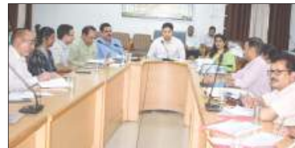
आयोजित एक दिवसीय कार्यशाला में मुख्य अतिथि भाग

उपायुक्त अपूर्व देवगन ने कहा कि जिला में टीबी मुक्त पंचायत अभियान के तहत स्वास्थ्य विभाग एवं पंचायती राज विभाग के संयुक्त तत्वावधान में 31 दिसंबर तक श्रृंखलाबद्ध गतिविधियों का आयोजन किया जाएगा। वे टीबी मुक्त पंचायत अभियान के तहत उपायुक्त कार्यालय के सभागार में