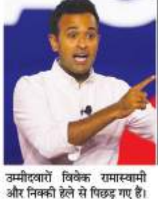
उम्मीदवारों विवेक रामास्वामी और निक्की हेले से पिछड़ गए हैं।

हैं। ट्रंप अभी तक लगातार पार्टी समर्थकों की पहली पसंद हैं और अन्य उम्मीदवारों में काफी आगे हैं। हालांकि ताजा सर्वे में ट्रंप की लोकप्रियता में थोड़ी कमी दर्ज की गई है। वहीं अभी तक दूसरे नंबर पर चल रहे फ्लोरिडा गवर्नर रॉन देसांतिस बुरी तरह पिछड़े नजर आ रहे हैं। निक्की हेली की लोकप्रियता भी बढ़ी रॉन देसांतिस, रिपब्लिकन पार्टी के भारतीय मूल के