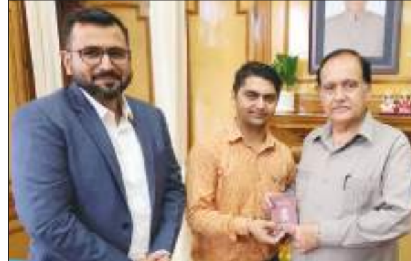
गौरवशाली इतिहास रहा है। उन्होंने कहा कि कौंसिल चैम्बर का निर्माण वर्ष 1920 से 1925 के बीच में हुआ था। इस सदन को विठ्ठल भाई पटेल तथा मोती