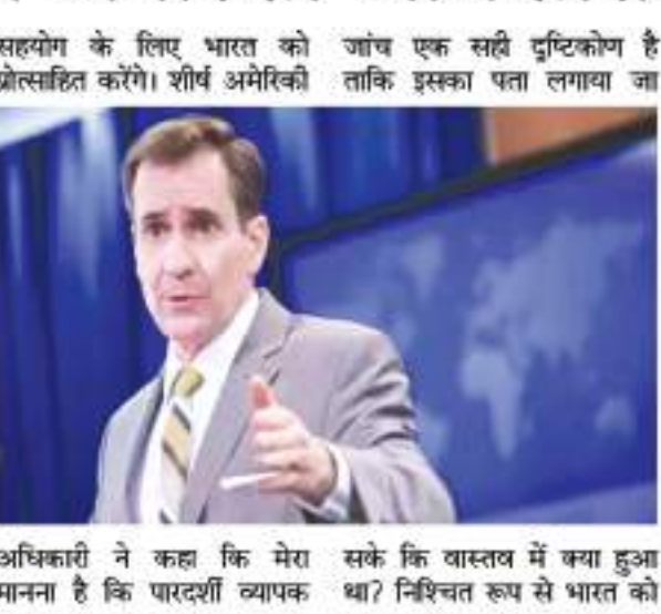
अधिकारी ने कहा कि मेरा मानना है कि पारदर्शी व्यापक जांच एक सही दृष्टिकोण है ताकि इसका पता लगाया जा